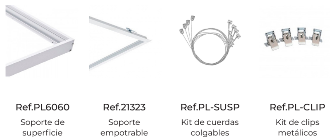
Ref.PL6060 Soporte de superficie